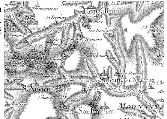
Carte de Cassini aux environs de St André la Côte

Cassini de Thury va établir sur le sommet de St-André-la-Côte (934m) un point d'observation pour établir par triangulation la première carte de Lyon entre 1758 et 1761. Le lieu appelé « Plat du foin » dénommé ensuite « Haut du Brun » est devenu « Signal » car dans le langage des cartographes, un signal est un système placé sur une borne (encore visible à St André) qui permet de repérer un point de visée de leurs appareils.